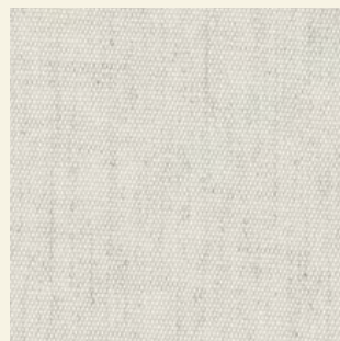
Life Ecu 1759