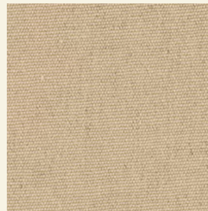
Life Beige 1761