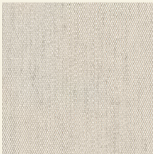
Life Oat 1760