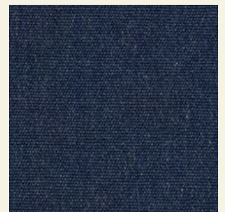
Life Indigo 1762

Due to the recycling process of LIFE products, colours may vary slightly from batch to batch. Debido al proceso de reciclado de los productos LIFE, los colores pueden variar ligeramente de un lote a otro.